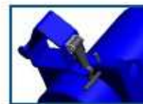
Abrazadera del tubo