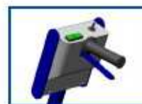
Panel de control de fácil acceso