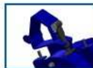
Abrazadera del tubo