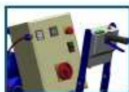
Panel de control de fácil acceso y lectura