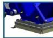
Imanes con cepillos