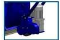
Sistema de avance eléctrico