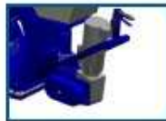
Sistema de levantamiento rápido