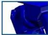
Motor de 15kW