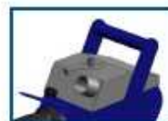
Sistema de separación de polvo