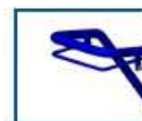
Freno de mano